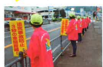
竹田 女性協による広報啓発活動