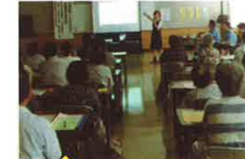
杵築 高齢者に対する交通安全教室