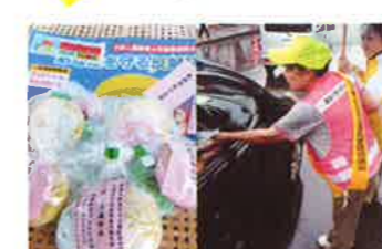
豊後大野 女性協による広報啓発活動