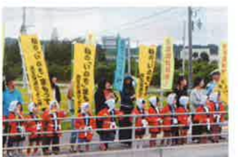
豊後高田 園児による広報啓発活動