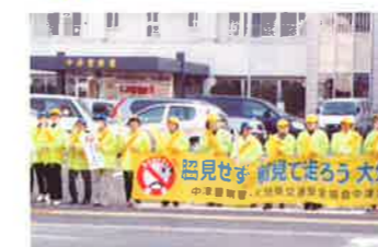
中津 会員による広報啓発活動