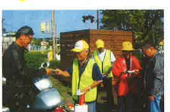
日出 会員によるバイク事故防止の呼びかけ