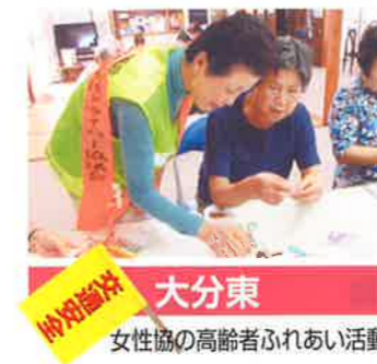
大分東 女性協の高齢者ふれあい活動

しかし、死者数は42人で年間の目標であった39人を上回り、課題を残す結果となりました。 本年は、第十次交通安全基本計画の2年目にあたり、交通事故のない安全で安心して暮らせる県民生活を実現するため、目標値である ●交通事故死者数を39人以下 ●負傷者数を5,900人以下 の達成に向けて、県警察をはじめ、関係機関・団体並びに地域のボランティアなどの皆様方との緊密な連携のもと、「おこさずあわす事故ゼロ」をスローガンに、「高齢者と子供の交通事故防止」「交通安全のすそのを広げる県民運動の推進」など各種交通安全活動を積極的に推進し、交通事故ゼロの実現を目指してまいります。 どうか本年も引き続き、交通安全協会の活動にご理解をいただきますようお願い申し上げます。結びに、本年が皆様方にとりまして、幸多い一年でありますよう心から祈念申し上げます。