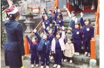
別府 園児に対する交通安全教室