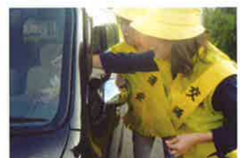
宇佐 会員による広報啓発活動