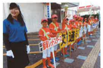
国東 児童による広報啓発活動