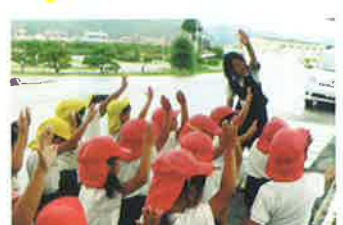
玖珠 園児に対する交通安全教室