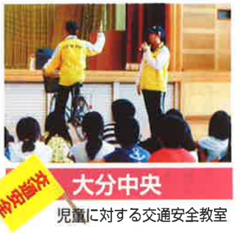
大分中央 児童に対する交通安全教室