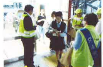
日出 JR駅利用者に対する広報啓発活動