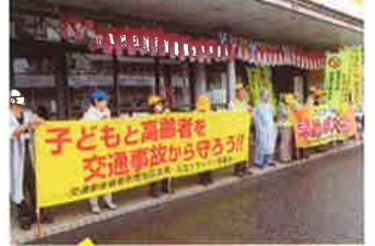
大分南 会員による広報啓発活動